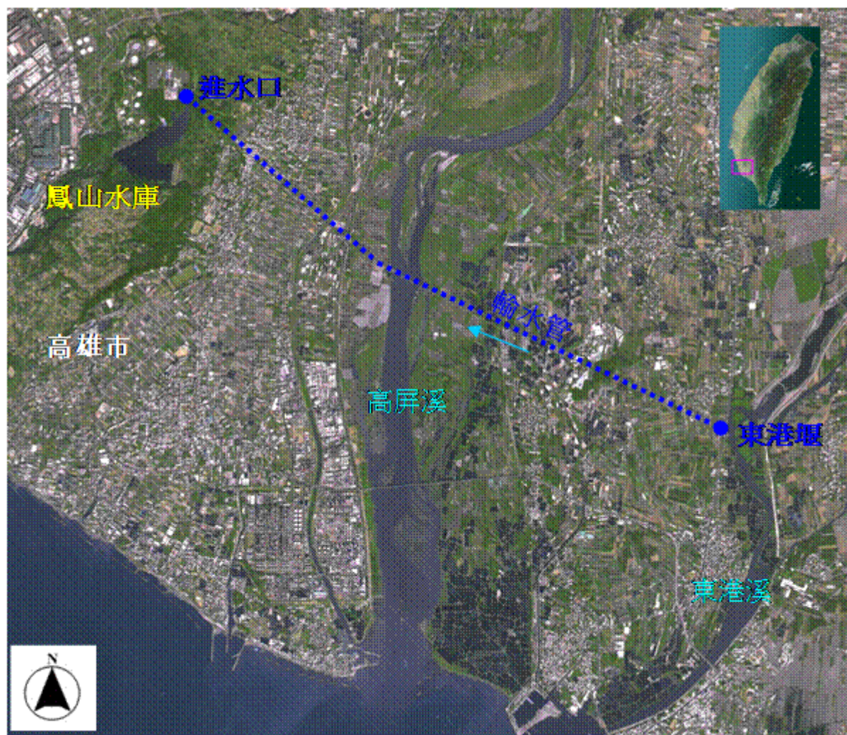
附圖一 鳳山水庫位置圖