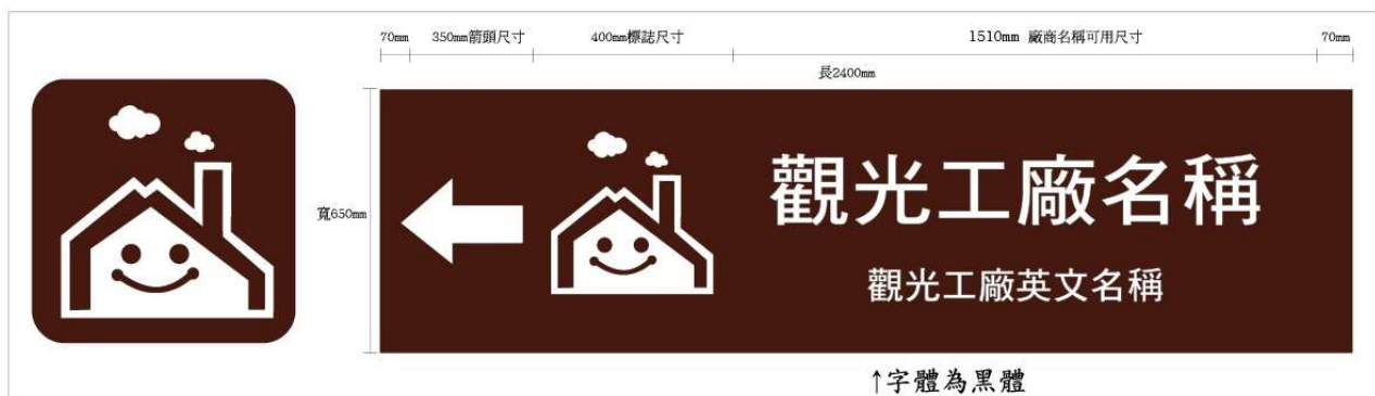
觀光工廠圖案造型預嵌指示標誌牌面格式